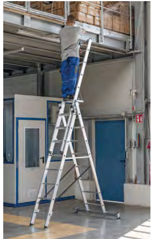
Abb. Bestell-Nr. 33308 und Bestell-Nr. 19910